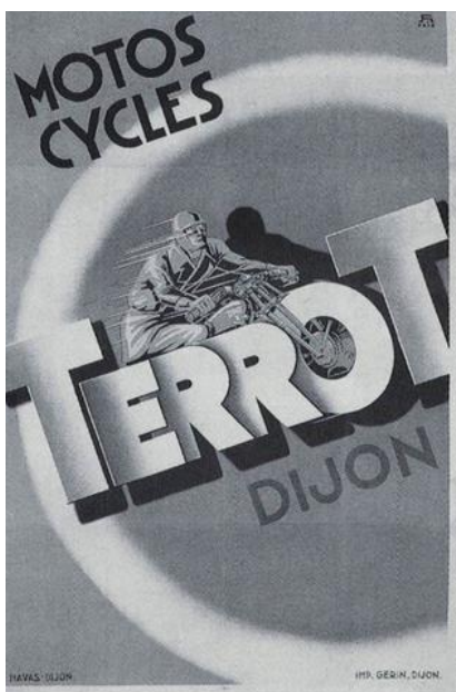
4 TERROT DIJON MOTOS/CYCLES

Magnat-Debon, société grenobloise s'est forgé une sérieuse réputation dès avant la première Guerre mondiale grâce au soin apporté à la fabrication de ses vélos et aux performances de ses motos. Accablée par la disparition de son brillant ingénieur Arthur Moser en 1919, la société tombe, en 1921, dans l'escarcelle de Terrot et Cie.