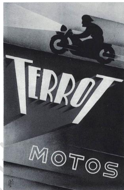
5 TERROT MOTOS

Pol Faye Dijon, agence Havas 1932 Signé haut droit Lithographie couleur H. 1,20; L. 0,80 Inv. 2000.1.1