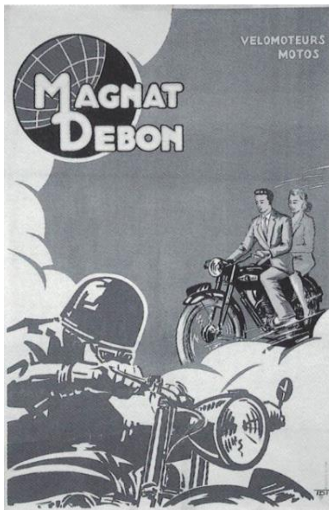
6 MAGNAT/DEBON VELOMOTEURS/MOTOS

T[errot] D[umay Terro]T Victor Dumay (1901-1981) Signé bas droit H. 1,22 ; L. 0,81 Inv. 2001.40.4