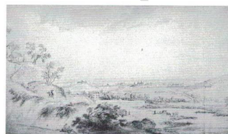
Jean-Baptiste Lallemand (Dijon, 1716 - Paris, 1803) Dijon vu de Daix plume et encre noire, rehauts d'aquarelle, H. 0,363; L. 0,632. Don de la Société des Amis des Musées de Dijon avec la participation du F.R.A.M. Inv. 1998-3-1. Dessin préparatoire au tableau du même artiste conservé au Musée des Beaux-Arts de Dijon. © Musée des Beaux-Arts de Dijon, cliché F. Jay

Album de dessins représentant essentiellement des vues de monuments de Dijon et de Bourgogne, H 0,489; L. 0,318. Don de la Société des Amis des Musées de Dijon avec la participation du F.R.A.M. Inv. 1998-5-1. © Musée des Beaux-Arts de Dijon, cliché F. Jay