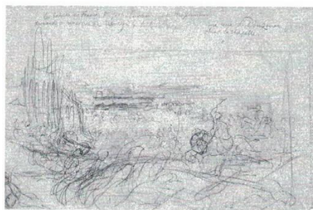
Eugène Delacroix ( 1798- Paris, 1863)