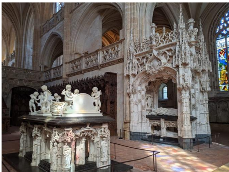
Tombeau de Philibert le Beau, début XVIe

Cet ensemble architectural rare a été bâti à grands frais par la très puissante Marguerite d'Autriche, duchesse de Savoie, gouvernante des Pays-Bas bourguignons, marraine et tante de Charles Quint, en mémoire de son époux Philibert le Beau : c'est un splendide hymne à l'amour, une dentelle de pierre