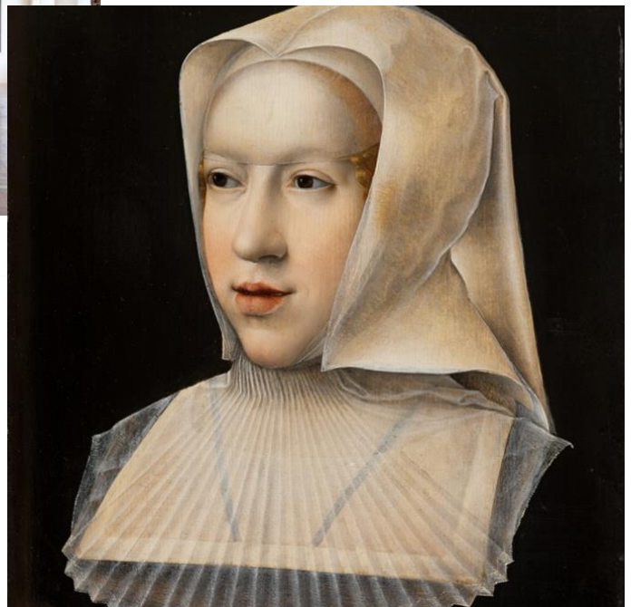
Marguerite d'Autriche par Bernard van Orley