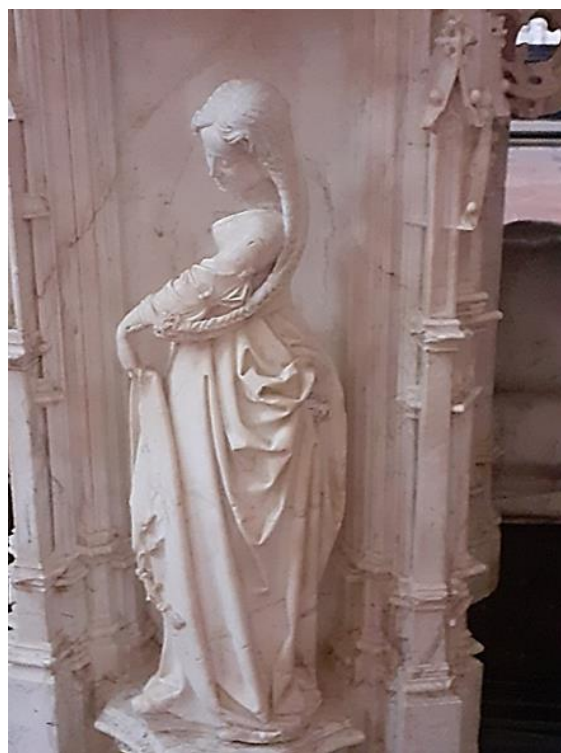
La sybille Agrippa 1

Cet ensemble architectural rare a été bâti à grands frais par la très puissante Marguerite d'Autriche, duchesse de Savoie, gouvernante des Pays-Bas bourguignons, marraine et tante de Charles Quint, en mémoire de son époux Philibert le Beau : c'est un splendide hymne à l'amour, une dentelle de pierre