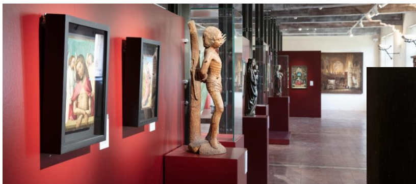
Quelques-unes des 434 œuvres d'art exposées