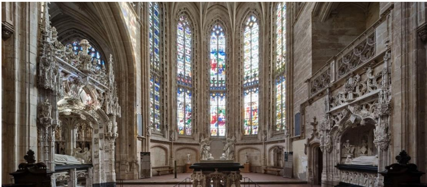
Les tombeaux de Philibert le Beau, de Marguerite d'Autriche et de Marguerite de Bourbon