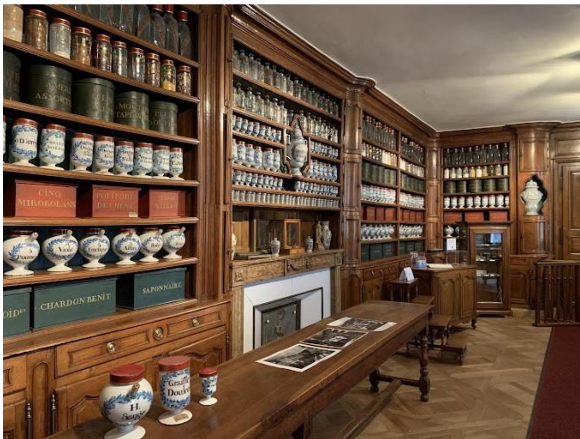
Apothicairerie à l'Hôtel-Dieu de Bourg-en-Bresse