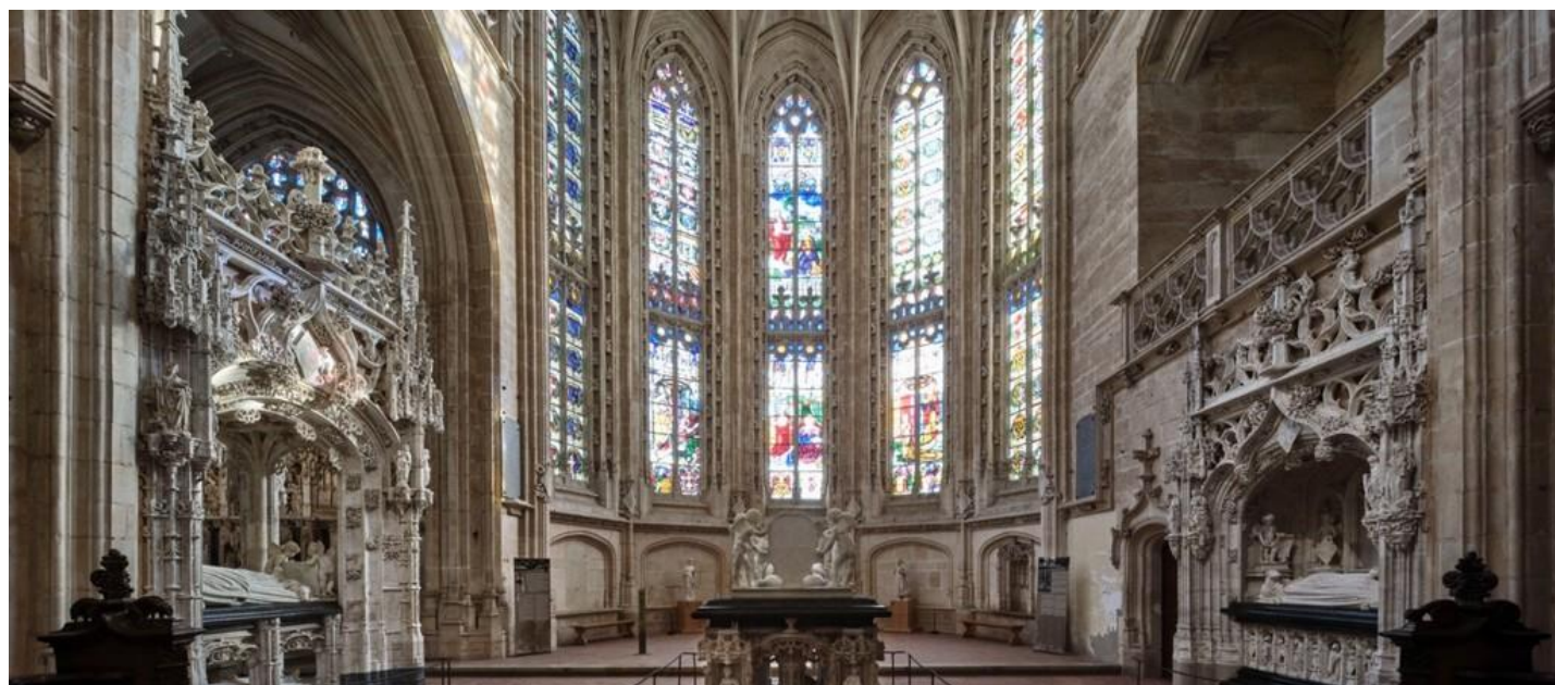
Les tombeaux de Philibert le Beau, de Marguerite d'Autriche et de Marguerite de Bourbon