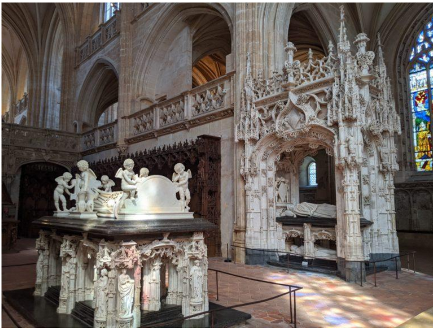
Tombeau de Philibert le Beau, début XVIe