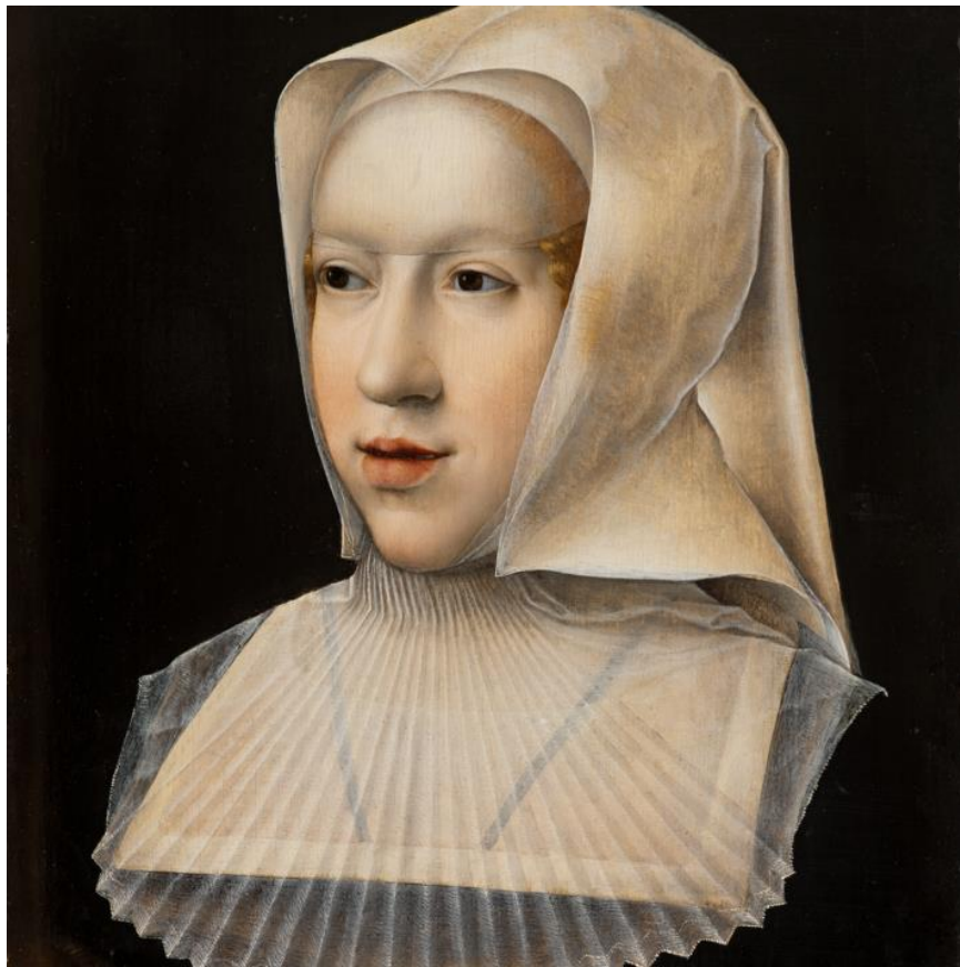
Marguerite d'Autriche par Bernard van Orley