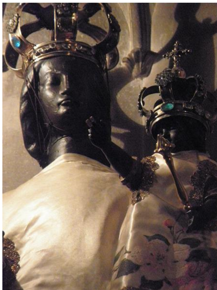
Statue de la Vierge noire