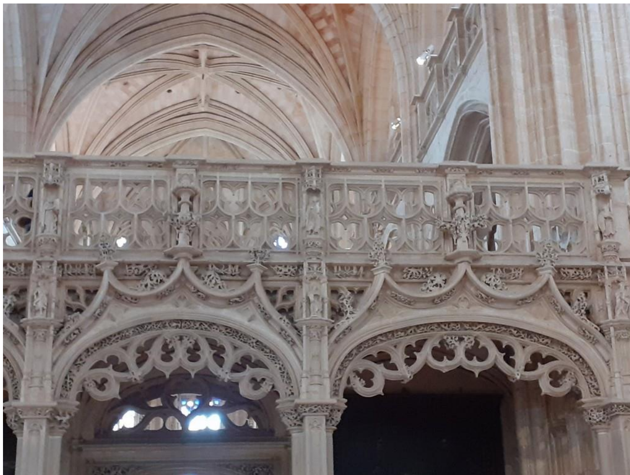
Dentelle de pierre du jubé