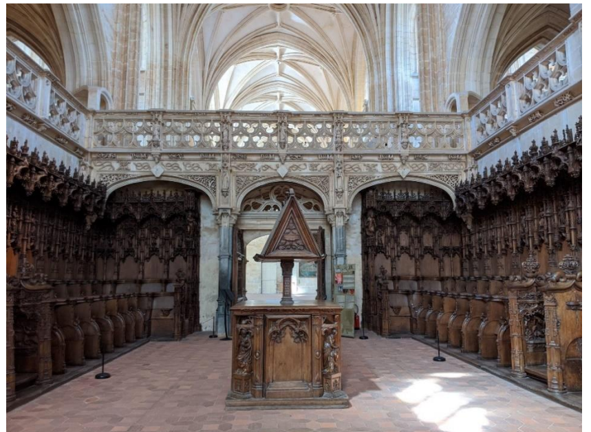
Stalles du chœur XVIe siècle au nombre de 74