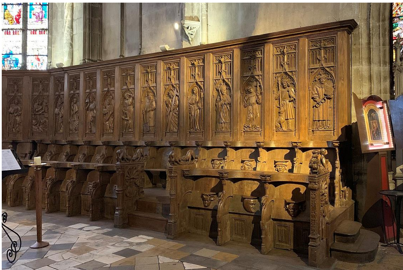
Une partie des stalles datées de 1768