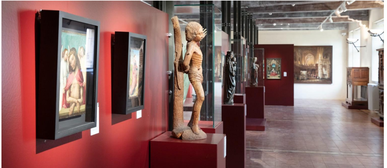
Quelques-unes des 434 œuvres d'art exposées